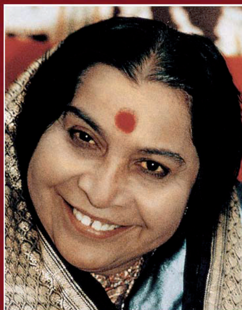
JEJ SVĀTOST ŠRĪ MATADŽI NIRMALA DEVI