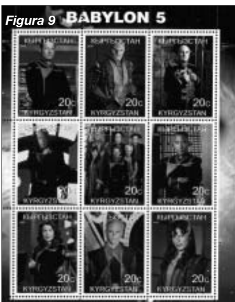
Figura 9 BABYLON 5