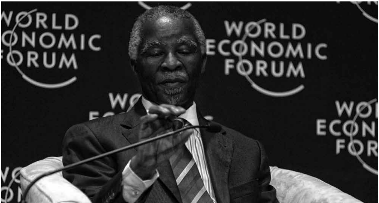
Thabo Mbeki, expresidente de Sudáfrica

primera parte estuvo centrada en las “famosas ecobolas”: explicó con todo lujo de detalles por qué en realidad no funcionan aunque mucha gente piense que sí.