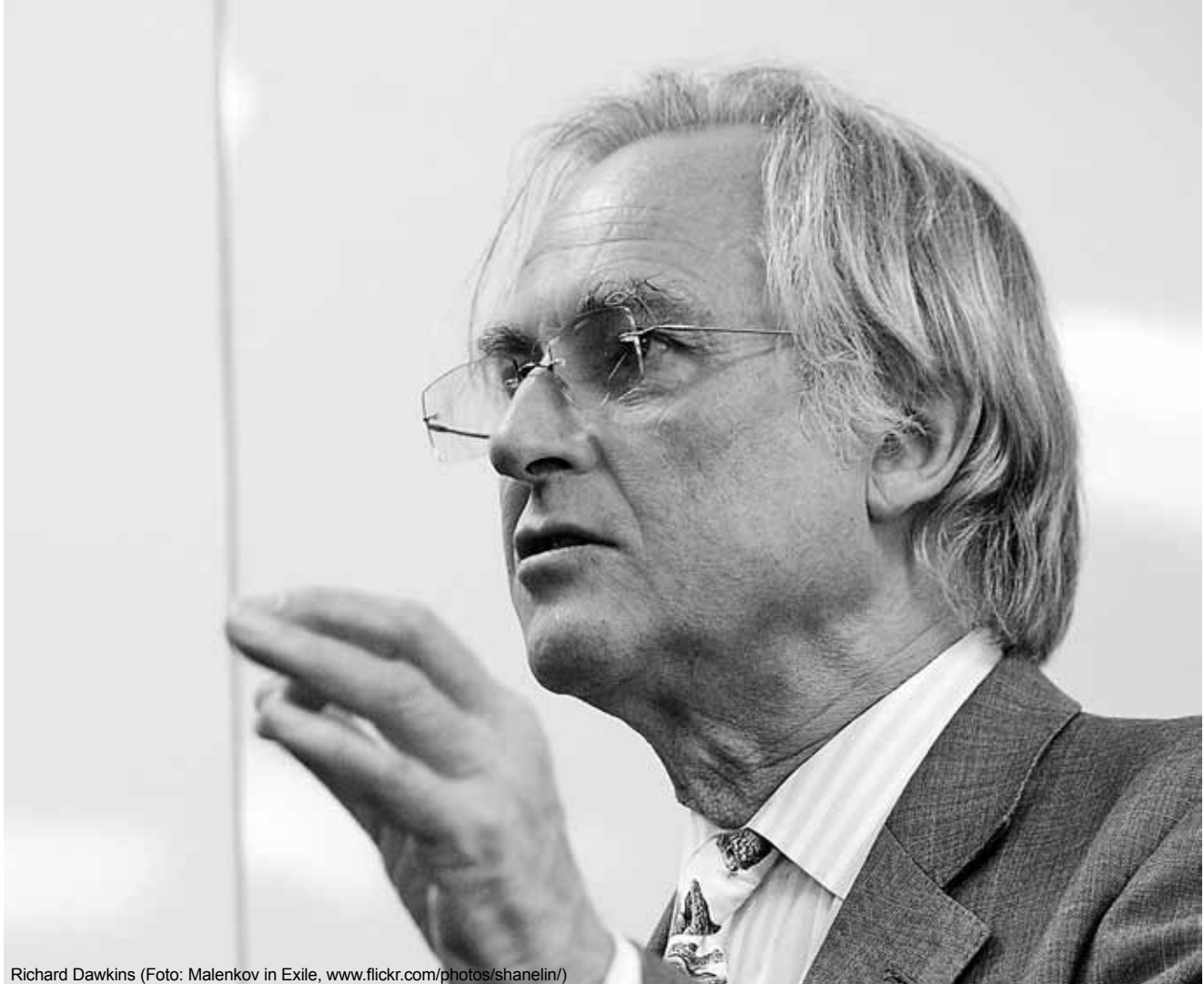
Richard Dawkins

entre sí (por ejemplo, mediante el comercio). La apertura de unas sociedades a otras, de unas culturas a otras, el pluralismo socio-cultural, produce a su vez otro conflicto, esta vez de interpretaciones. La confrontación de mitos, religiones y formas de entender la realidad de cada cultura, tuvo que producir una especie de “shock” cognoscitivo, y la necesidad de preguntarse por la verdad de cada una de esas interpretaciones. Una pregunta que presupone la duda previa acerca de lo que antes se tenía por verdadero tan solo porque así había sido recibido por la tradición y la autoridad. Es en este contexto en el que tiene que surgir la filosofía como reflexión acerca del propio conocimiento y de su origen, límites y validez. No es casualidad, por tanto, que la filosofía aparezca precisamente en las colonias griegas o que se desarrolle en Atenas, centros todos ellos de pluralismo cultural, y es que el pluralismo es conditio sine qua non de la propia filosofía: en una sociedad homogénea no hay filosofía, sino que perdura la credulidad.