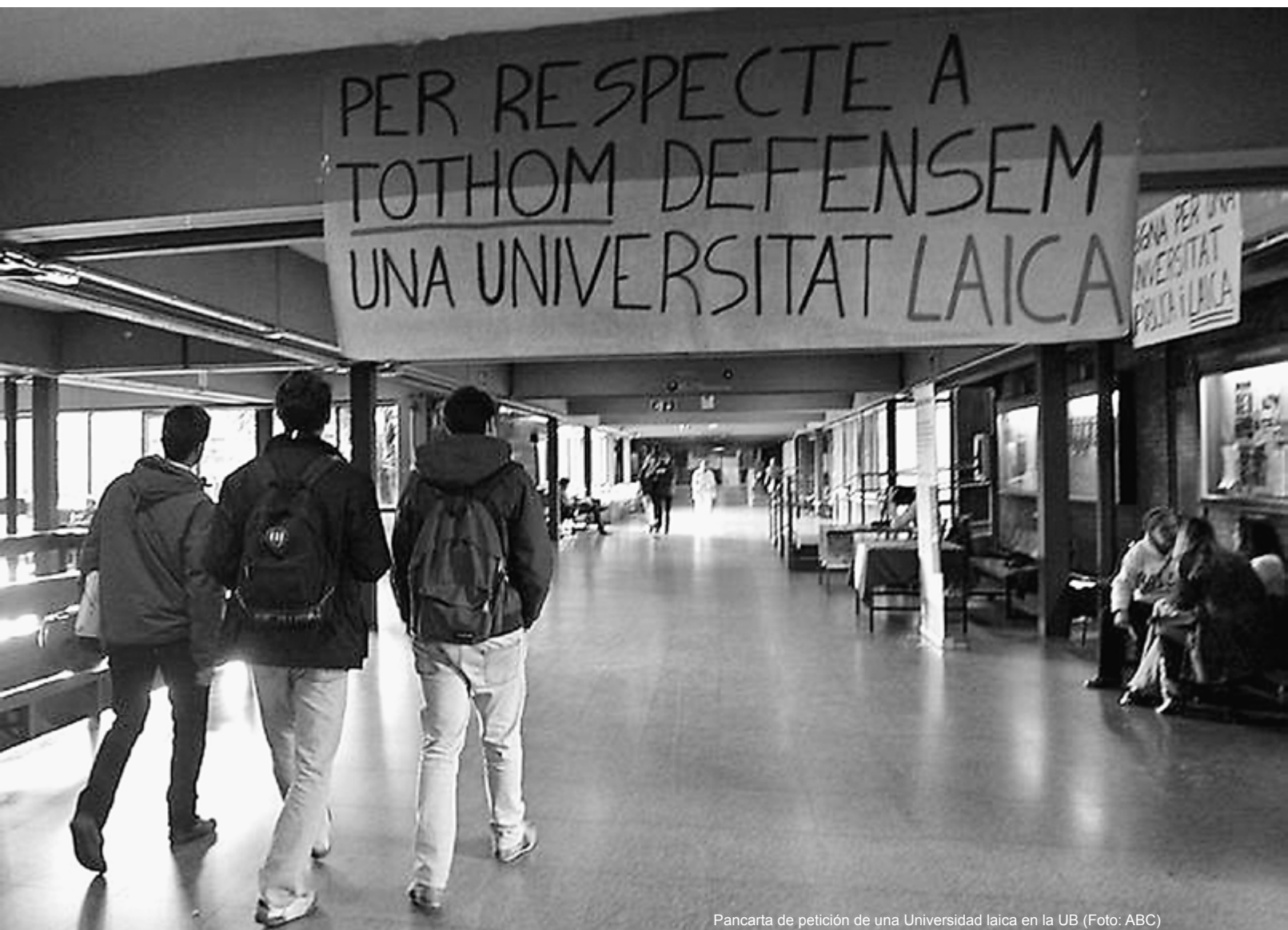
Pancarta de petición de una Universidad laica en la UB

cial de la credibilidad de lo que se ofrece aparentando el rigor que a la Universidad se le supone.