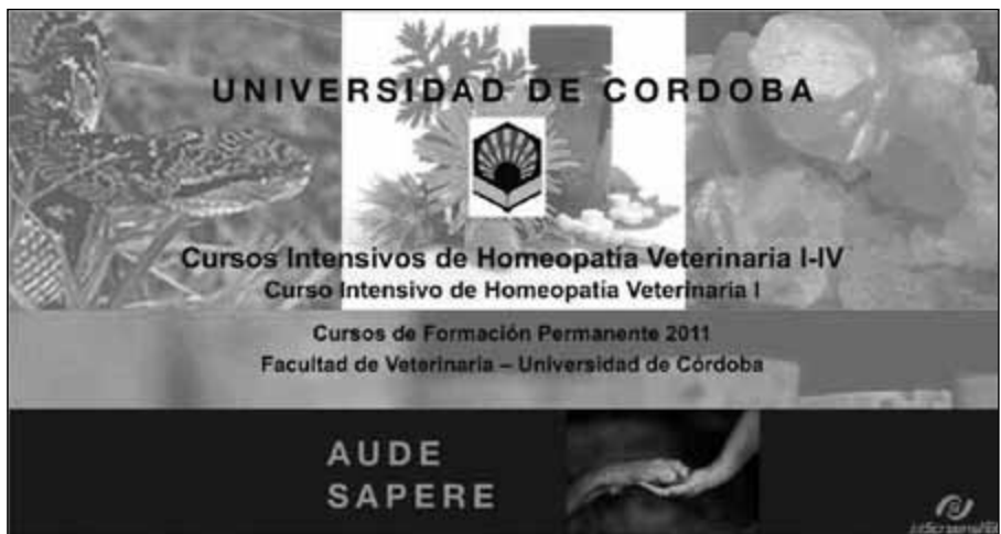
Detalle de un diploma de Especialización en Terapéutica Homeopática de la Universidad de Zaragoza y cartel de cursos intensivos de Homeopatía veterinaria en la Universidad de Córdoba.

grave, a mi juicio, es que la UCLM, a nivel institucional, calló y sigue callada.