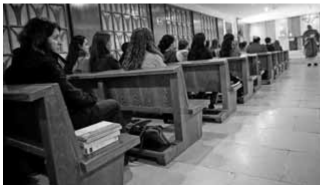
Unas 50 personas acuden cada día a la misa de las 13:30 horas en la capilla de la facultad de Derecho de la Universidad Complutense de Madrid.

en la Facultad de Económicas y otra en el edificio central, junto al rectorado. En los años sesenta había aulas-capillas en otras facultades, pero se fueron eliminando. En otro campus catalán, el de la Autónoma de Barcelona, lleva 20 años prestándose el Servicio de Asistencia y Formación Religiosa. Existe una sala multifuncional que es utilizada por otras confesiones.