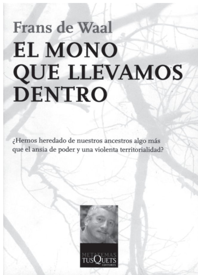
Portada original (Tusquets)

Una postura contraria sostiene Frans de Waal , eminente primatólogo para quien nuestras más nobles características —la generosidad, la amabilidad, el altruismo y la solidaridad— forman parte de la naturaleza humana, pues proceden de nuestro pasado animal.