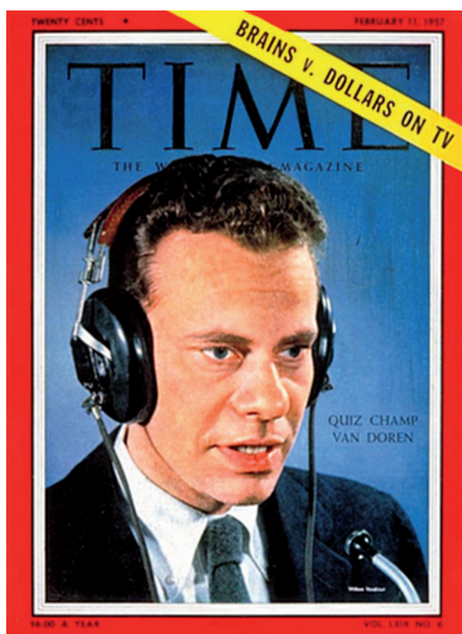
Fotografía del autor, portada de Time en 1957 [ Time ]

contrario que otros libros, como la Guía de la ciencia de Isaac Asimov, este libro no se contenta con listar de forma más o menos coherente una serie de fechas, nombres y descubrimientos; o relatarnos algunas anécdotas de los principales protagonistas del avance del conocimiento humano. Van Doren condensa, pone en contexto y compara los avances del conocimiento más importantes de cada época. Curiosamente, en ocasiones una época son décadas y en otras, siglos o milenios. Lo hace con un punto de vista ingenioso, con un lenguaje directo y con periódicas frases