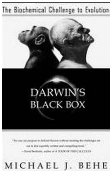
Portada del libro Darwin's Black Box: The Biochemical Challenge to Evolution , por Michael J. Behe.

en los cuales el conocimiento de los evolucionistas dista de ser íntegro.