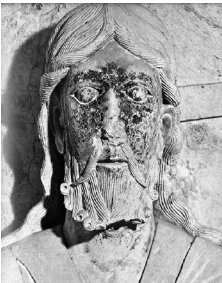
Cristo de la iglesia de Ste. Madeleine, en Vézelay (Francia)- Vuelve a observarse la posición frontal y la simetría

La losa se calienta a una temperatura entre 200 y 300 grados (230 es una buena temperatura). Después, encima de ella, muy cerca, pero sin tocarla, se pone una tela de lino, durante dos minutos. Y ya está, se forma la imagen.