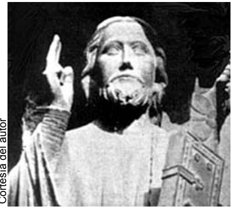
Cristo de la catedral de Amiens. Obsérvese que el cuerpo y la cara se presentan frontalmente y son muy simétricas.

8) Algunas de las consideradas "manchas de sangre", especialmente la de la frente, muestran un color algo diferente al resto, un poco más rojizas.