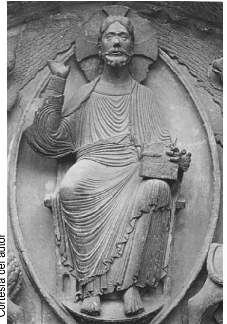
Cristo de la catedral de Chartres (Francia). Una vez más nos encontramos con una imagen frontal y totalmente simétrica.

cantidad de calor depende de la distancia del bronce a la tela y hay tantos tonos como distancias. El segundo es que es muy difícil que, con la transformada de Laplace, el frotado no mostrase una cierta direccionalidad. No es imposible, pero es difícil.