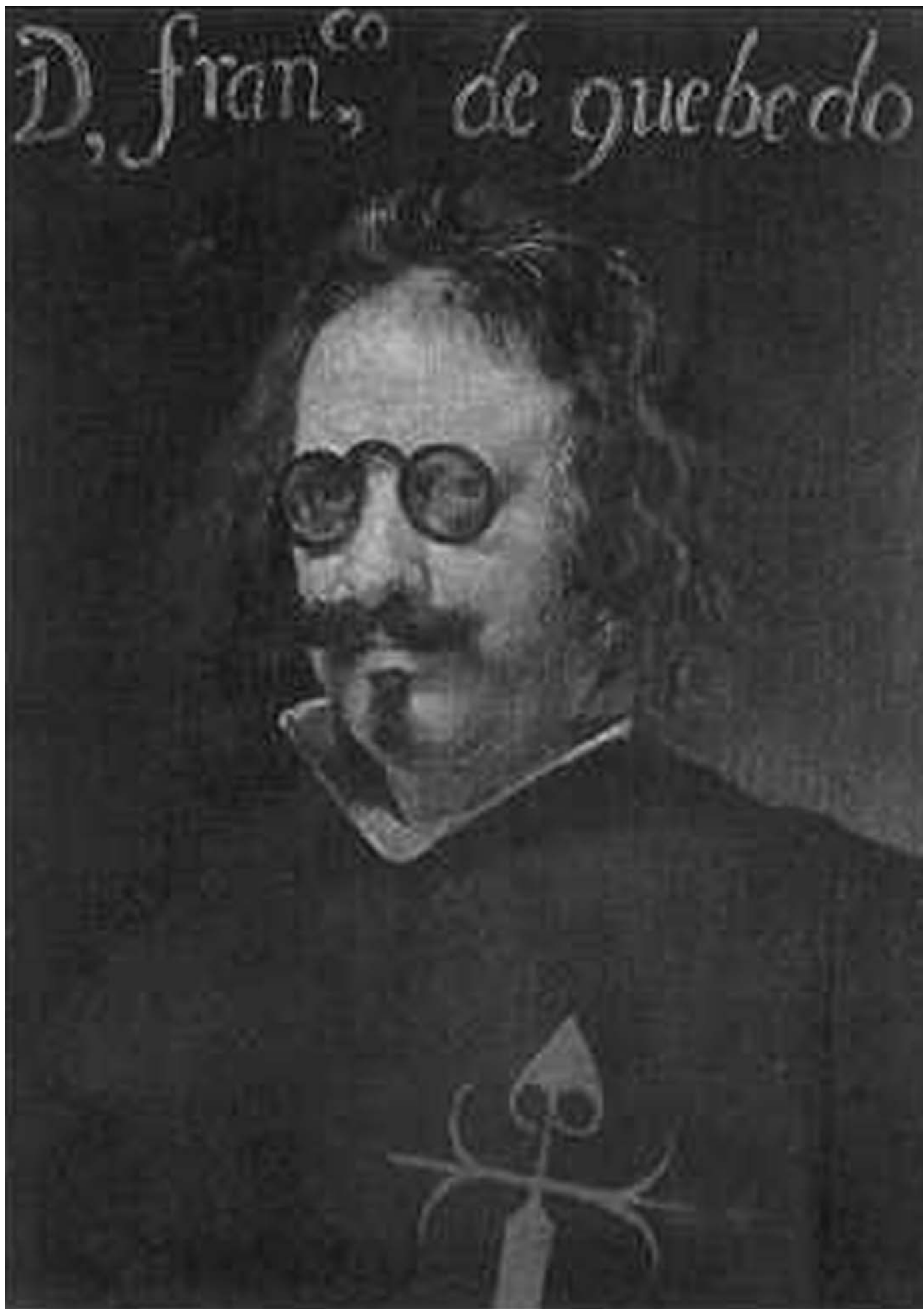
Francisco de Quevedo (1580-1645).