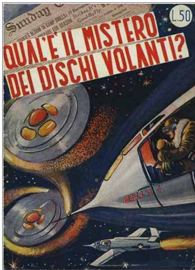
Primera portada en la que aparece el término "platillos volantes" en un tebeo italiano (1950). http://factoreblog.com/2015/08/28/visita-de-ensueno-al-museo-ovni-de-tuscia-italia/

Civita es casi inaccesible con medios modernos de transporte. Para llegar a ella tienes que ascender lentamente por un empinado y estrecho puente suspendido a unos 300 me-