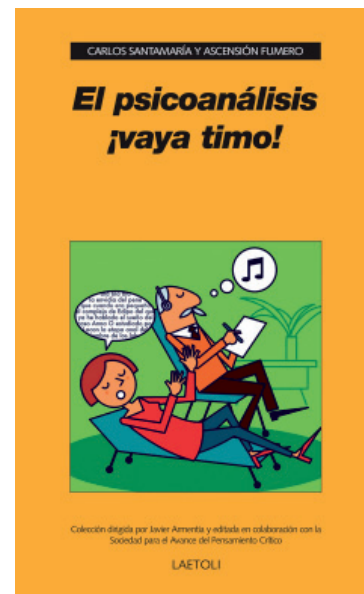
Portada de uno de los ¡Vaya timo! (Laetoli)

El acto consistió en la presentación de una nueva colección de libros: la traducción al castellano de los trece libros que