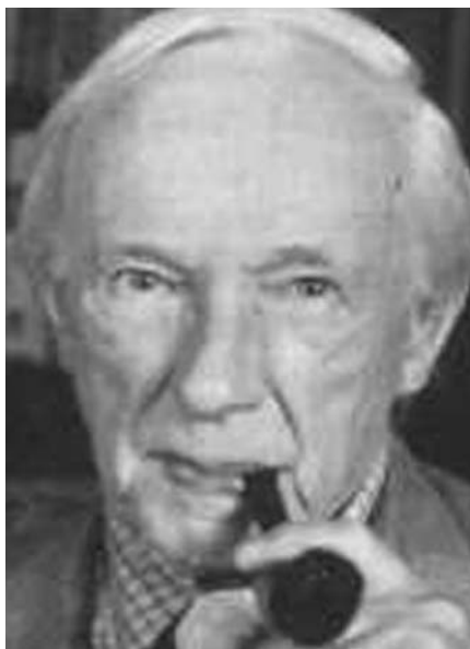
George Edward Moore (11/04/1873-10/24/1958).

Cuando George Edward Moore publicó en 1903 sus Principia